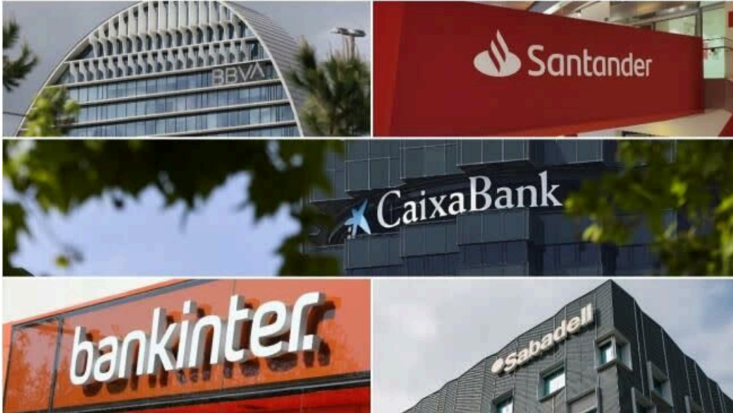
Más comisiones y menos costes de personal: deberes de la banca para mejorar su rentabilidad

Tal y como ha explicado Santacruz, se entiende por coste de capital el rendimiento mínimo que debe ofrecer una inversión a los actuales y futuros inversores . Son muchas las variables que inciden en el coste de capital de la banca: el nivel de los tipos de interés, la regulación, el ratio de eficiencia, la morosidad, la política de reparto de dividendos y otros muchos más, incluso el modelo de negocio. También se destaca que el coste de capital varía mucho en el tiempo, lo que hace necesario un seguimiento estrecho de este indicador por parte de los gestores y de los analistas.