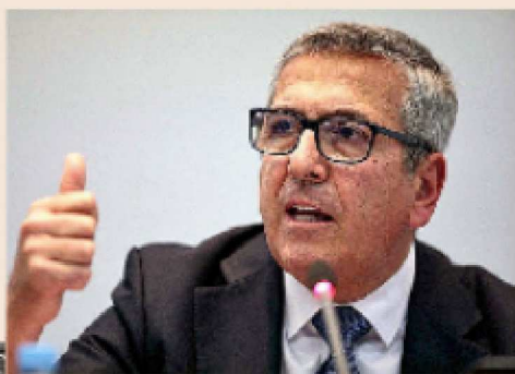
José Carlos García de Quevedo, presidente del Instituto de Crédito Oficial (ICO)

El hecho de que los cupos estén agotados no significa necesariamente que las entidades hayan introducido ya todos los expedientes de los préstamos en la plataforma telemática dispuesta por el ICO a tal fin. Se trata de un proceso que lleva su tiempo porque hay que incorporar mucha documentación. Además, en el caso de los grandes